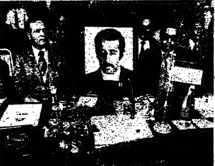
صورة وزير النفط الإيراني الذي لا يزال في أسر السلطات العراقية، وتوسط الوفد الإيراني مؤتمر دول «أوبيك» الذي افتتح أمس في مدينة يالاي، في كندا.